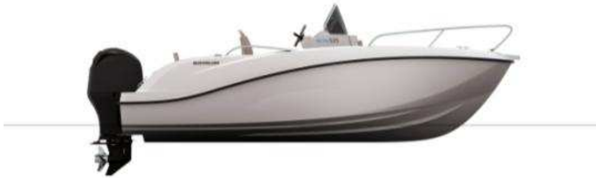
Bow and Console